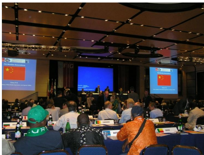
Момент от ГА