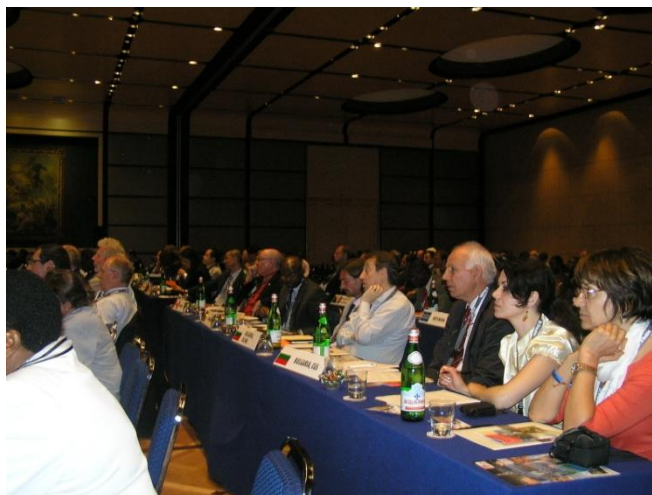
СГЗБ и КИГ на ГА

България бе представена от СГЗБ и КИГ. Страната участва в гласуването, проведено на General Assembly на 10 май.